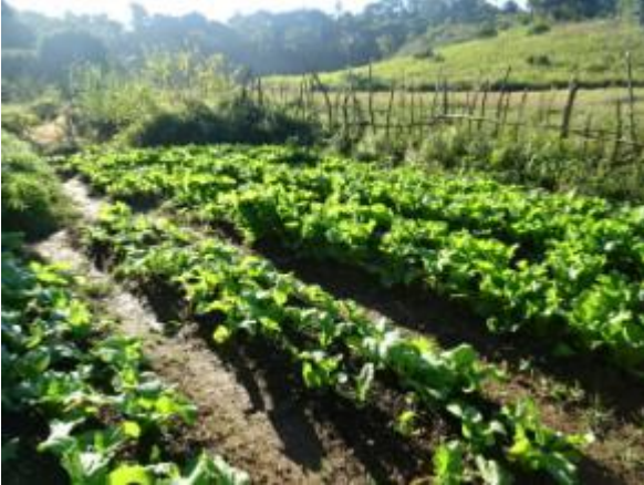
Parcelles sur un terrain collectif