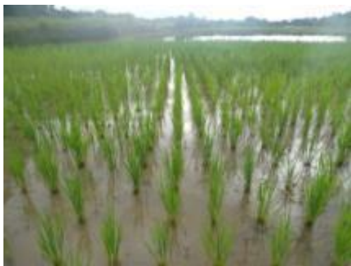
Parcelle de riziculture améliorée en démonstration

Besoin de renforcement des berges du canal amont