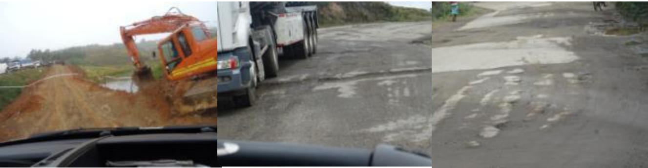
La Nationale 7