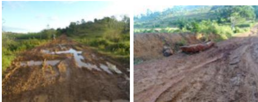
La piste vers Ifatsy