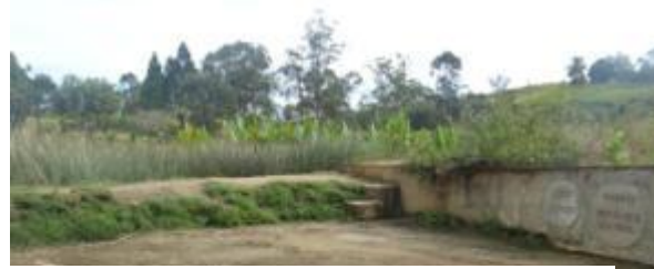
Canal supplémentaire, retenue et prise d'eau