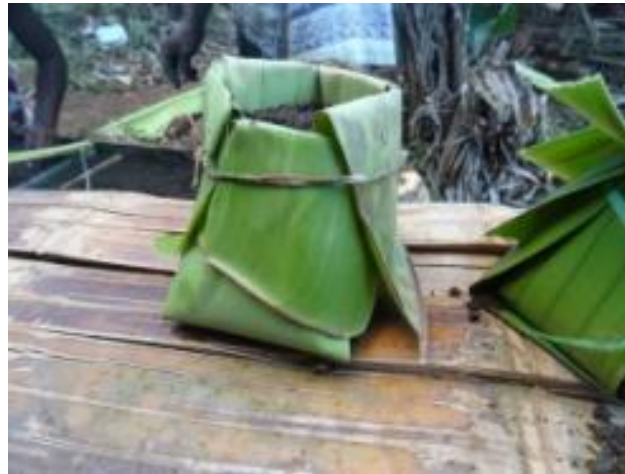
Pots en feuille de ravinala