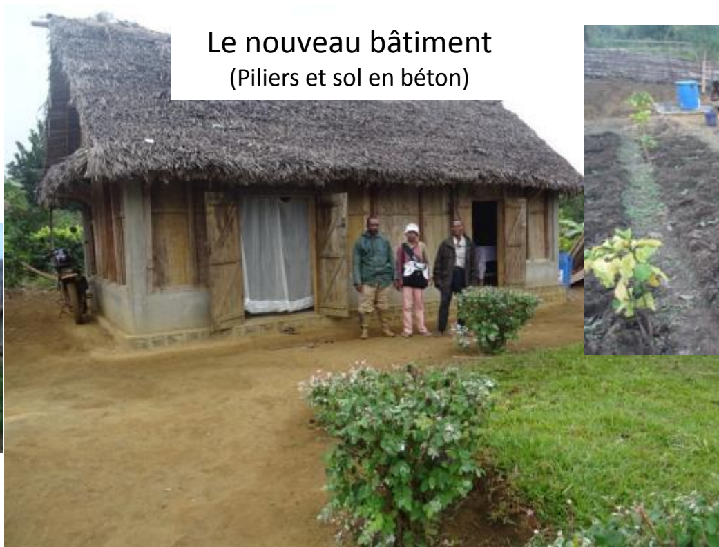
Le nouveau bâtiment (Piliers et sol en béton)