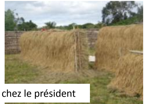
Riz et légumes chez le président