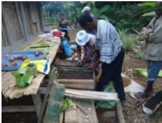
Semis sur table et en bacs bambou