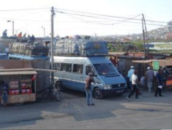
Taxi bé pour la route