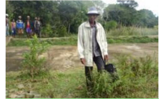
Projet de siphonage et canal pour irriguer d'autres parcelles