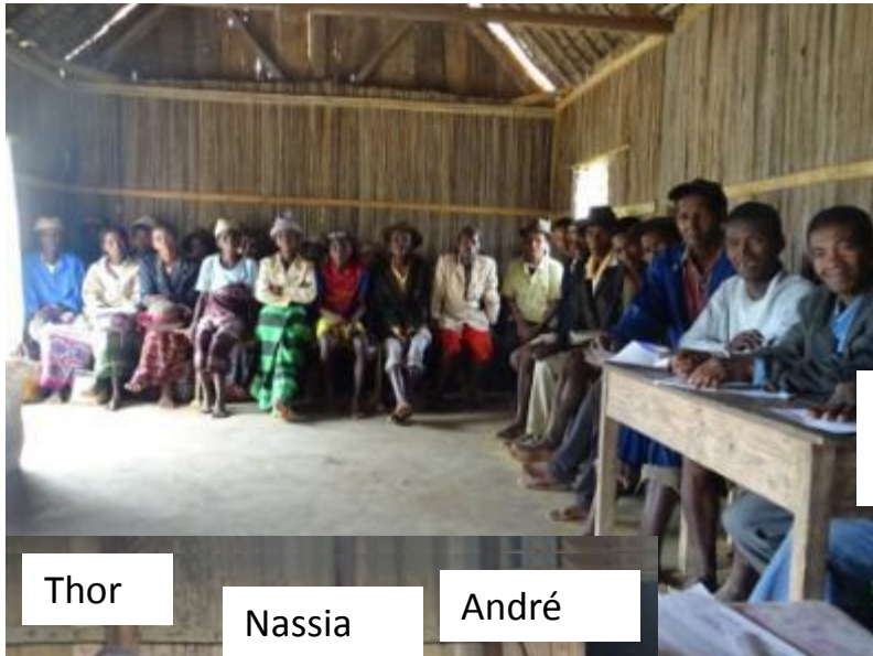
Une partie des membres

Union de 5 groupements de producteurs du district de Vohipeno - 221 familles