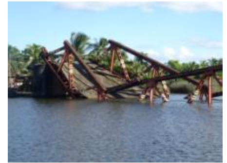
Le pont de Manakarabé