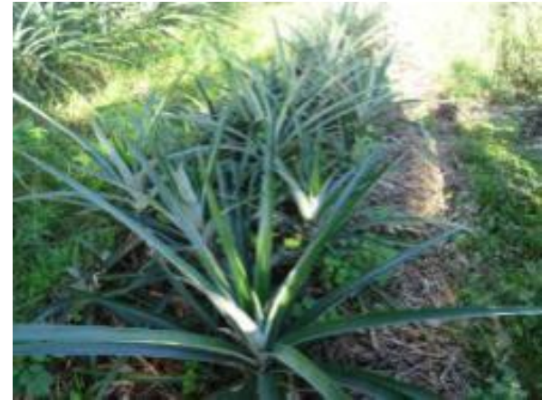
Ananas en planche et floraison contrôlée