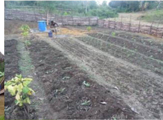
Parcelle de culture légumière