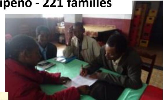
Le bureau de l'Union des producteurs FTMV lors de la signature de la convention