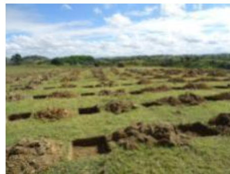
Champ collectif de manioc en préparation