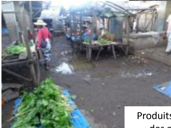
Produits présentés sur des nattes au sol