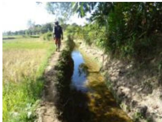
Partiteur, bief et canal de dérivation